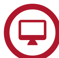
Blackline Live™- Webportal